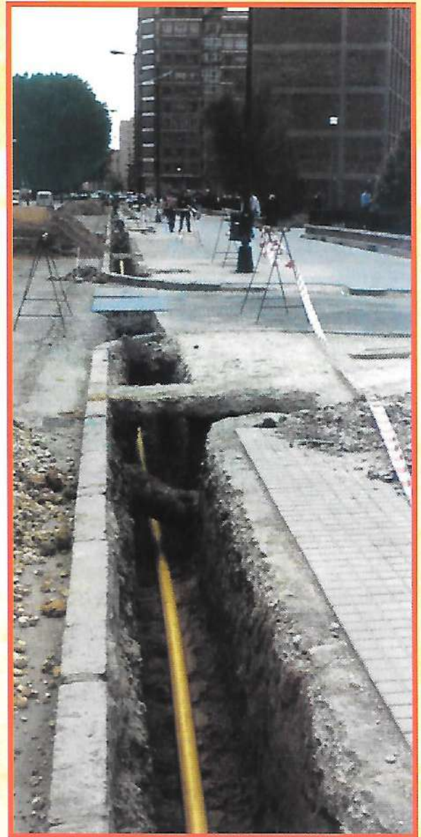
Obra civil y tendido de tubería de PEMD para la distribución doméstica de gas natural