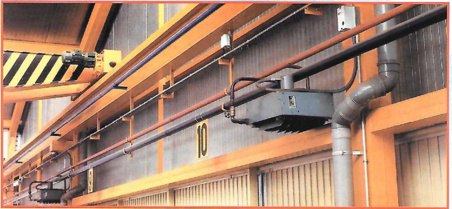
Calefacción industrial en base a aerotermos y caldera a gas natural